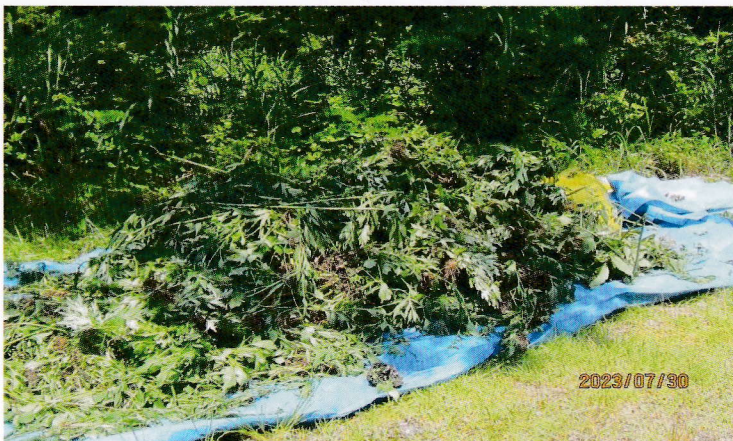
みんなで駆除した成果