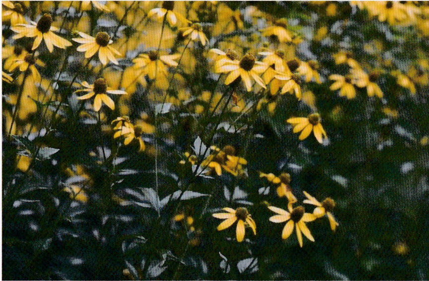
繁茂したオオハンゴンソウ

8:45谷川岳インフォメーションセンター駐車場集合。 9:00～15:00 インフォメーションセンターでの講義があります。 どなたでも参加できます。オオハンゴンソウは根がはっているので根かき道具をご持参ください。 参加費無料。昼食・飲料ご持参ください。定員35名先着順。 傷害保険に加入。参加者負担なし。 申し込みは群馬県自然保護連盟まで。 027-289-6165・080-8747-0548事務局長