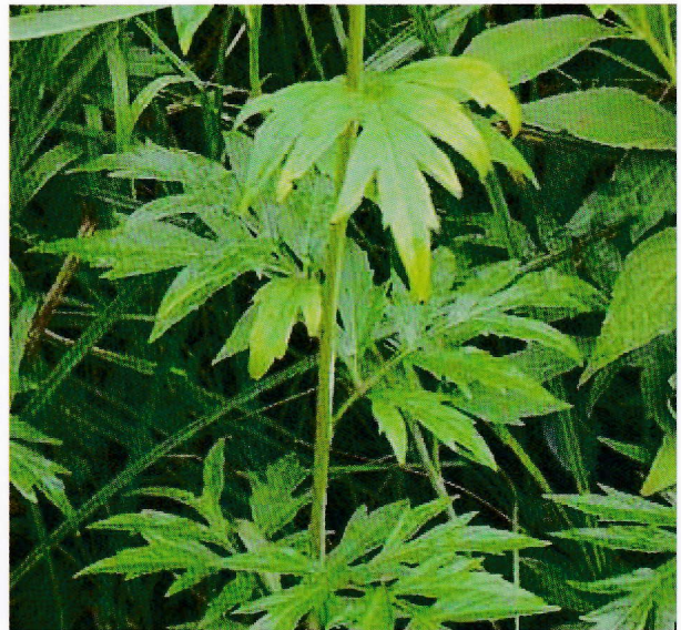
オオハンゴンソウの葉