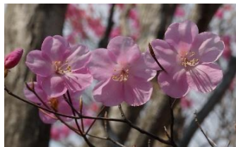
葉が出る前に咲きます

【申込み締切日】4月25日(木) 先着30名 ※ビュウ植物・歴史・文化など楽しい解説付きの稜線歩きです！ 8:45～ 受付(赤城公園ビジターセンター:VC集合) 9:00～ VC(車で移動)=小沼P=長七郎山(右回り)=茶ノ木畑峠=横引尾根=銚子ノ伽藍=横引尾根= 15:00 茶ノ木畑峠=小沼水門1,473.7m=小沼(右回り)=(車で移動)=VCにて※講習会・解散