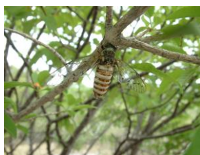
シャワシャワと鳴くセミ ギーギーと鳴くセミ