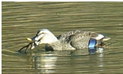
ヤマアカガエルを捕食