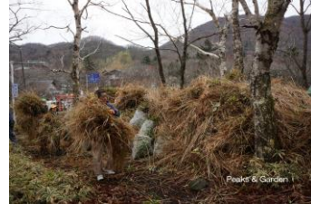
刈り取ったススキ