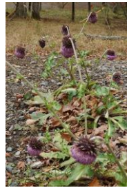
明るい乾いた砂礫地