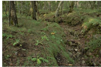
暗くじめじめした沢沿いの移植先