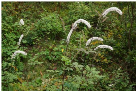
サラシナショウマ

●以下の文章は、赤城山山頂部の植生の保護と観光資源としての利活用について述べたものである。( ) に適する語句を入れなさい。