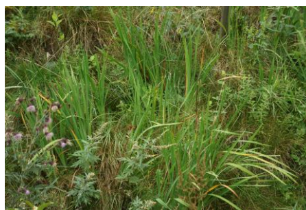
ノハラアザミ、ゼンテイカ、チダケサシ etc.