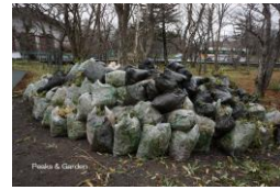
刈り取ったササの山

50 「覚満淵自然観察会」は「〇〇」を資料としてツアー・林間学校等予約受付で実施している。〇〇とは何か次のうちのどれか。