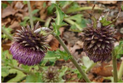
日本最大のアザミ『フジアザミ』