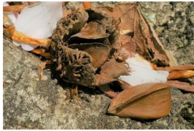
イガイガの中には3個の種