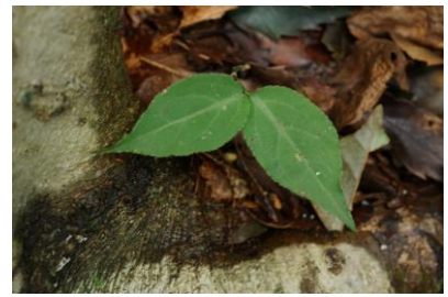
榕樹の葉は1年に1枚