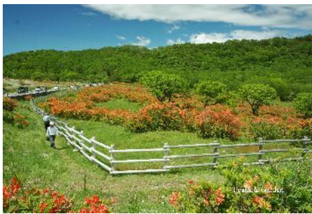
新坂平の牧柵とハイカー