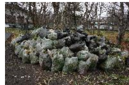
刈り取ったササの山