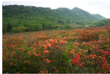
新坂平と赤城カルデラの外輪山