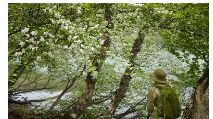
小沼湖畔のシロヤシオ

【申込み締切日】 5月31日(火) 先着30名 8:45～ 受付(赤城公園ビジターセンター:VC集合) 9:00～ VC(車で移動)=小沼P=長七郎山(右回り)= 小沼水門=小沼(右回り)=VC(車で移動) 15:00 覚満淵自然観察会・VCIにて講義・解散