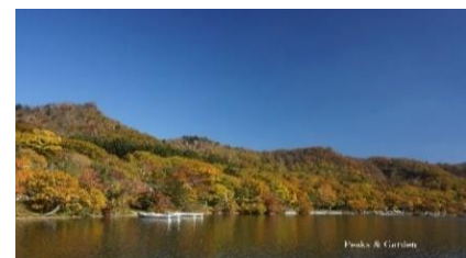
出張山・薬師岳1528m・陣笠山の稜線を歩く

【申込み締切日】 10月19日(水) 先着30名 8:45～ 受付(青木旅館集合) 9:00～ 青木旅館=厚生団地=出張峠=出張山=野坂峠= 薬師岳=野坂峠=厚生団地=青木旅館 15:00 覚満淵自然観察会・VCIにて講義・解散