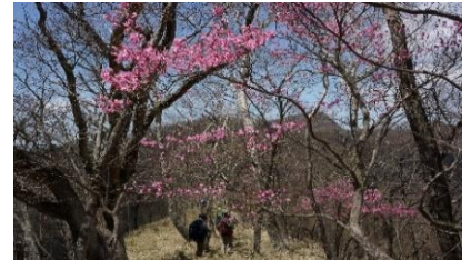
横引尾根のアカヤシオ

【申込み締切日】 4月27日(水) 先着30名 8:45～ 受付(赤城公園ビジターセンター:VC集合) 9:00～ VC(車で移動)=小沼P=茶の木畑峠=横引尾根= 茶の木畑峠小沼P=箆山(車で移動)=VC(車で移動) 15:00 覚満淵自然観察会・VCIにて講義・解散